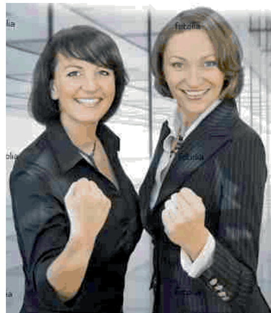
Nur jeder Fünfte ist so motiviert!

Aus den Befragungsergebnissen gehe auch hervor, dass es kaum einen